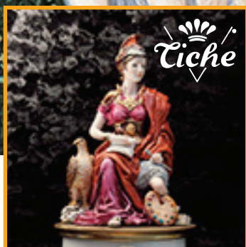
alle pagine 8-9 la Tiche