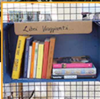
a pagina 11 SBV in tasca